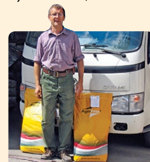
Vámosiéék egyik üzlettársa Garán

Mindkét forgalmazónak köszönjük az eddig hozzánk intézett bizalmát, további munkájukhoz pedig ezúton is jó egészséget kívánunk. ■